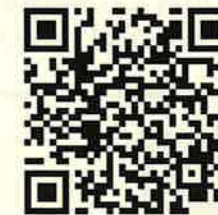
年間行事カレンダー WEB版QRコード