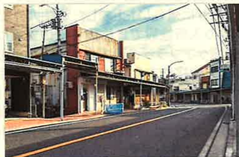
植木屋があった辺り(令和6年2月14日撮影)