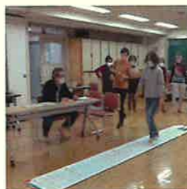
2ステップテストの様子

また、乳癌モデルという器具を用いて乳癌に触れる感覚を体験し自己触診の習慣や定期検診の大切さを実感できる良い機会となりました。